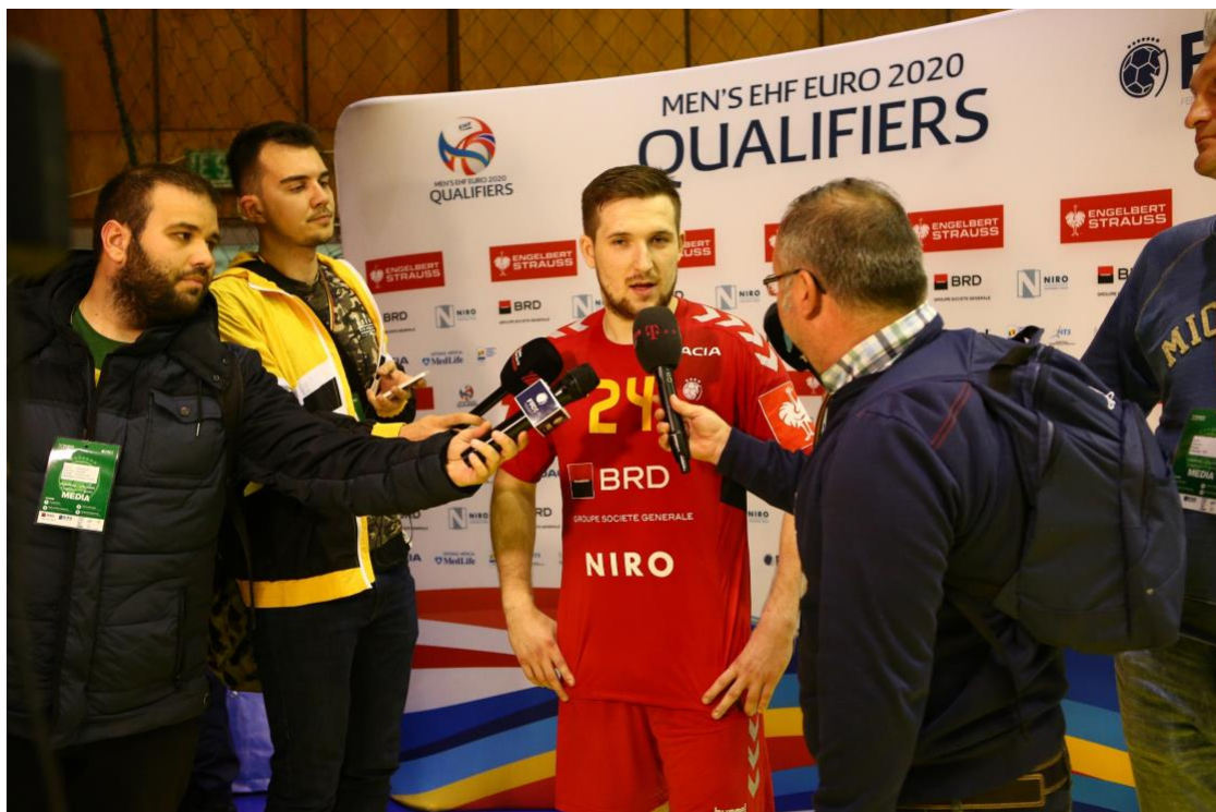
Fotografie panou interviuri