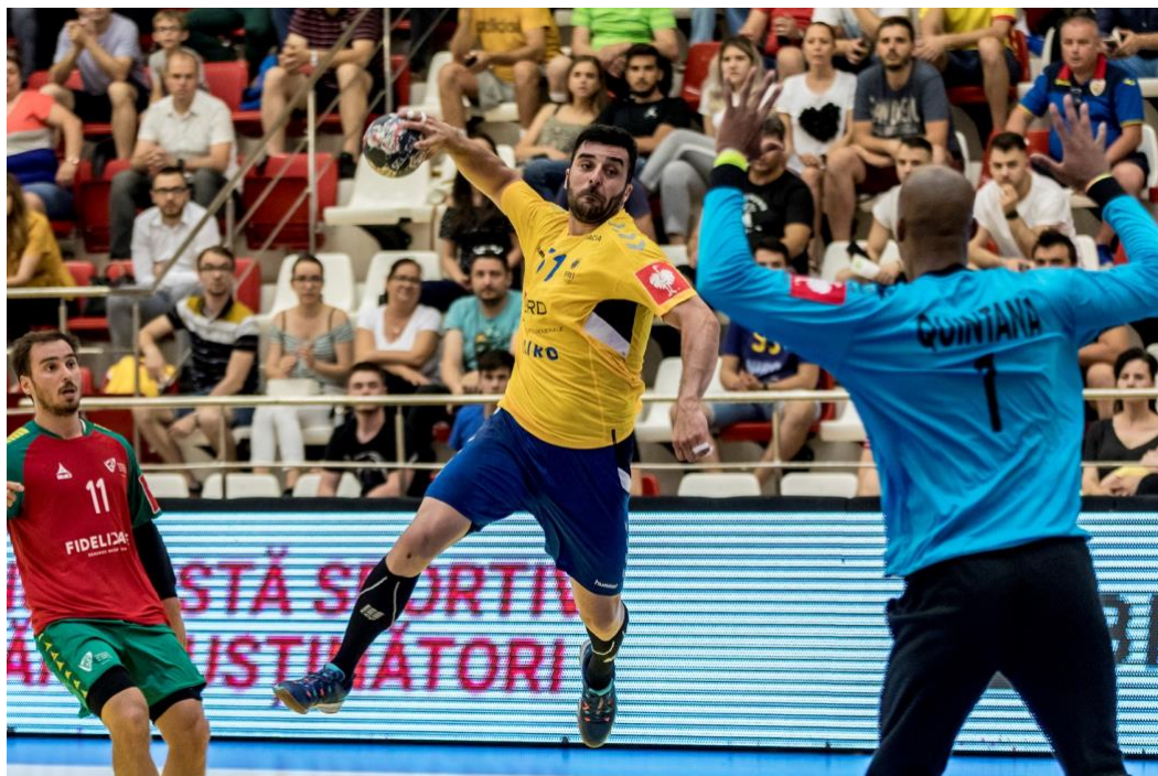
Fotografie de acțiune