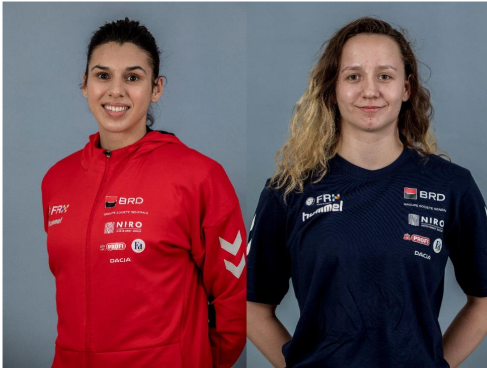
Fotografie bust semiprofil și central – echipament de prezentare