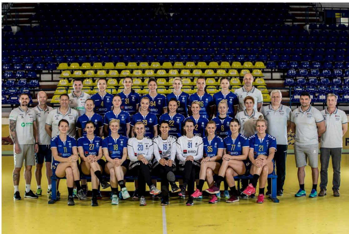
Fotografie de grup