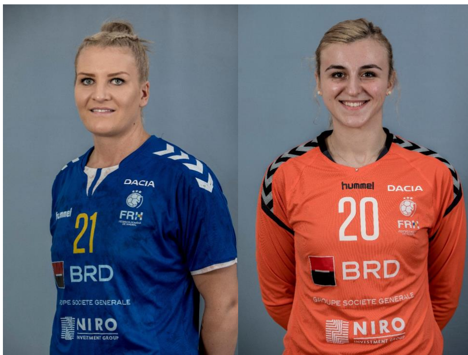
Fotografie bust semiprofil și central – echipament de joc