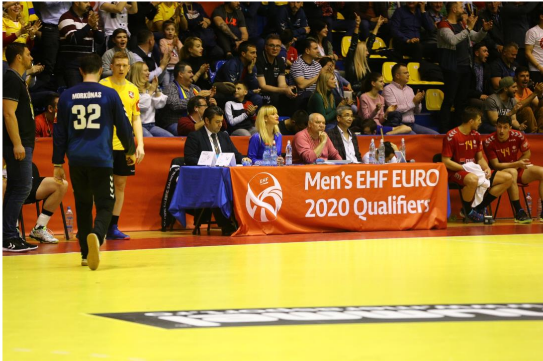
Fotografie banner masa oficială